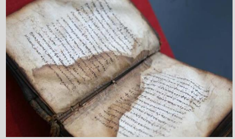
سبب الرفض: الكتابة أو الرسم أو التحديد على الكتاب