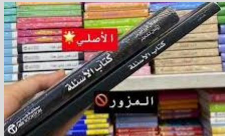
سبب الرفض: نسخة الكتاب مزورة وليست أصلية